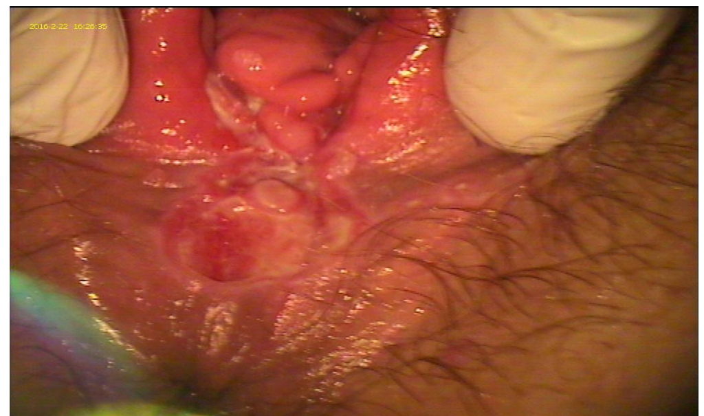
A la semana