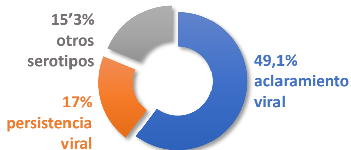
Tasas de aclaramiento viral en función de la edad y serotipo

En el periodo estudiado, los resultados a los 6 meses fueron: